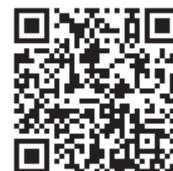
TruVent 機能紹介動画 (7分)

TruVent を使って、学習者は人工呼吸器の操作に必要な基本的なスキルを簡単に習得できます。インストラクターは、従来のクラス単位の対面式授業や、別の場所からのリモートで1人または複数の学習者を同時にトレーニングすることができます。